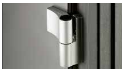
2 zweiteilig, aufliegende Türbänder , dreidimensional verstellbar, in EV1*