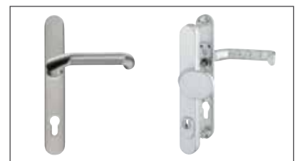
Schutzbeschlag als Drücker- oder Wechselgarnitur in EV1