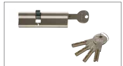
Profizylinder mit Not- und Gefahrenfunktion inkl. 5 Schlüsseln